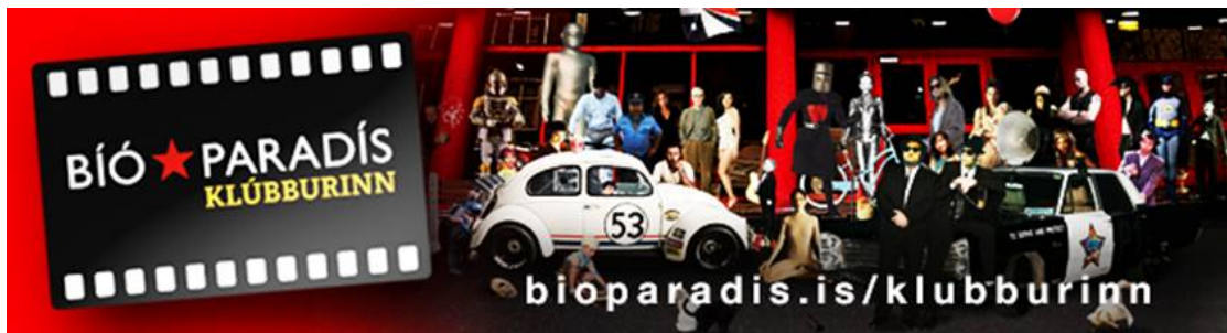
M.5 Lógó Bíó Paradís